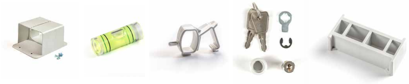
PIEZA DE ENLACE